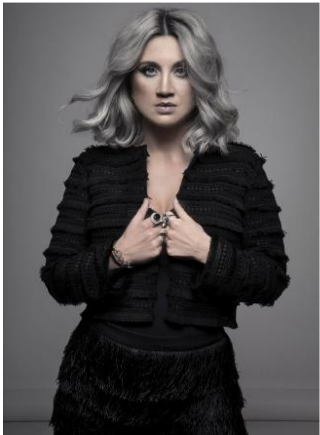
Camilla Läckberg, giallista svedese autrice de «La Strega»

Credo siano più d'uno. Innanzitutto, da svedese, noto che il mio paese gode di un certo credito all'estero. Magari si tratta di stereotipi «buoni», come il welfare, la natura, il benessere e una certa libertà anche nei legami familiari, però la Svezia è una nazione di riferimento per tanti aspetti e questo tiene alta l'attenzione. Poi (sorride) spero di metterci anche un po' del