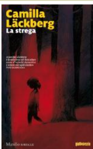
La copertina del libro

file di miei conoscenti che vogliono dare corpo a nuovi protagonisti e la frase che ricorre più spesso è «Mi fai uccidere un parente?». Insomma, dopo i primi passi un po' timidi, il matrimonio tra la Fjällbacka della finzione e il paesino reale funziona. Paesino che è stato rilanciato anche sul fronte turistico: una volta era il luogo di vacanze di In-