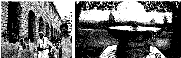
La Gran Guardia ospiterà la mostra dal 27 novembre al 7 marzo 2010