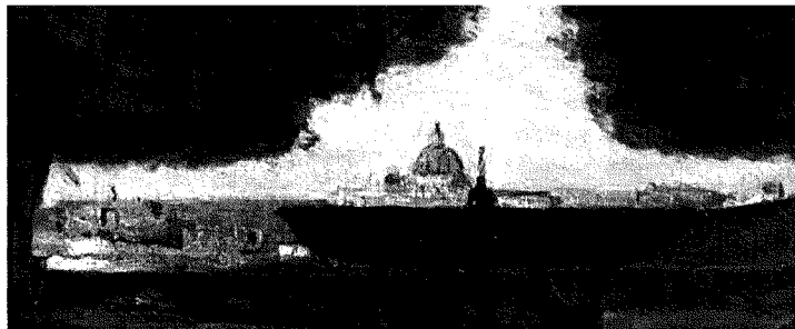
Jen Baptiste Corot, «La vasca di villa Medici», una delle opere più importanti del maestro francese

Vanno ricordate alcune figure e ritratti come quelli delle signorine Sunnegon, la Ragazza che fa toeletta e la famosa Marietta, odalisca romana che nel disegno sintetico e nella definizione di uno spazio creato unicamente dai toni e dalle linee prelude alla pittura di Cézanne, così come l'attenzione per i valori atmosferici ha anticipato gli impressionisti. Corot muore a Parigi nel 1875, a 79 anni.