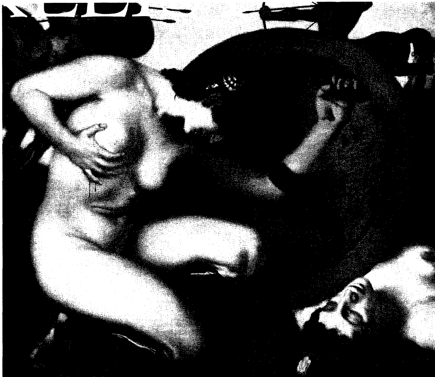
Franz von Stuck, «Amazzone ferita», 1904, Amsterdam, Van Gogh Museum